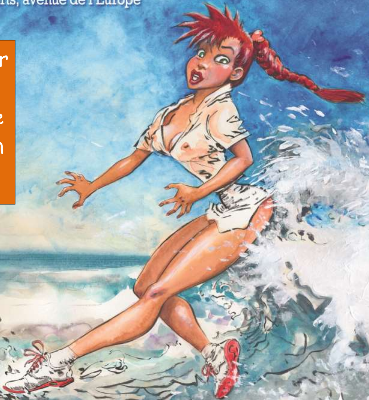
Illustration de Marc HARDY

Entrée 2 €, Gratuit moins de 16 ans 06 14 10 14 46 www.bdm33.fr